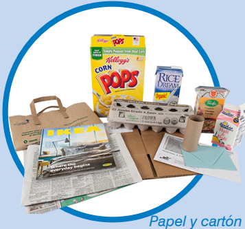
Papel y cartón

Paper Newspapers, magazines, mail & envelopes (windows ok), office/scrap paper, cartons, flattened cardboard boxes