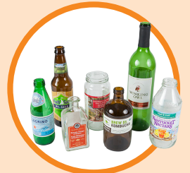
Bottles and jars

Botellas y frascos de vidrio Separar el vidrio en el contenedor rojo. Quite los tapones y corchos. Puede dejar las etiquetas. NO poner floreros, vasos o focos.