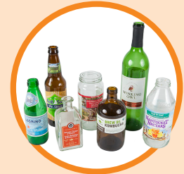
Botellas y frascos

Glass bottles and jars Put glass into separate red bin. Remove lids. Labels OK.