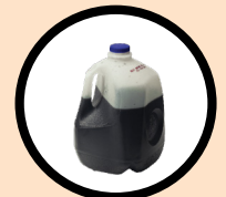
Aceite de motor

NO vases, drinking glasses, or lightbulbs.