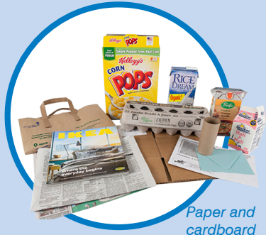
Paper and cardboard

Papel Periódico, revistas, correo, sobres, recortes o papel triturado, envases de cartón, cajas de cartón aplanadas.