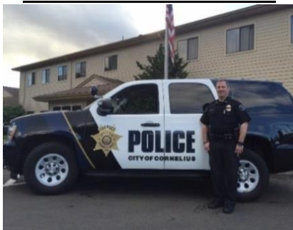
jefe de Policía Al Roque